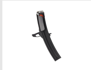
Artikel code 014640 NAGELMAGAZIJN 50 STUKS - PULSA 800