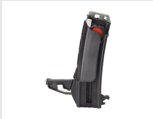
Artikel code 014623 NAGELMAGAZIJN 20 STUKS - PULSA 800