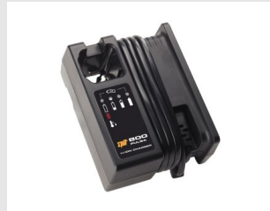
Artikel code 018482 ACCULADER - PULSA 800