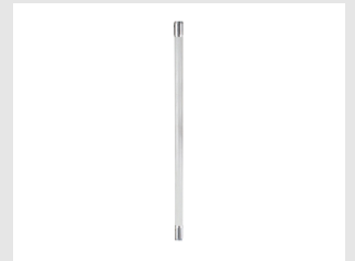
Artikel code 018849 VERLENGSTUK 75 CM T.B.V. SPIT PULSA 800 E-LIFT