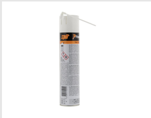
Artikel code 115251 IMPULSE & PULSA REINIGER 300 ML