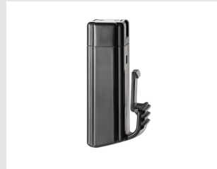
Artikel code 018483 ACCU - PULSA 800