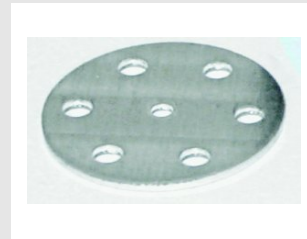
Artikel code 011204 PULSA RONDEL 25 MM