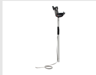
Artikel code 018820 PULSA 800 E-LIFT PLAFONDSYSTEEM