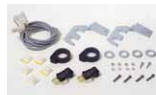
Kit eindschakelaars open en dicht