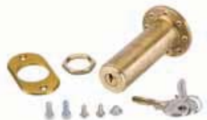
Externe ontgrendeling met sleutel voor garagedeuren groter dan 15 mm. dikte (van n° 1 tot n° 36)