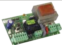
Stuurprint 596/615 BPR Technische specificaties zie p. 195