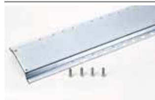
Basisplaat 1,5 m.