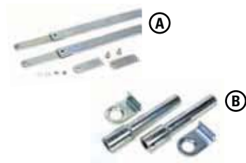
Set toebehoren voor centrale (1 motor) of dubbele montage (2 motoren)