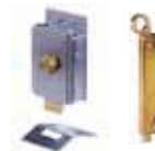
Diverse toebehoren pagina 179