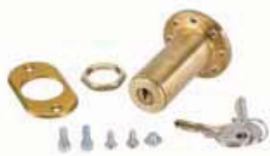
Externe ontgrendeling met sleutel voor garagedeuren tot max. 15 mm. dikte (van n° 1 tot n° 36)