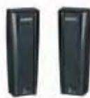
Fotocel XP15B (met BUS-technologie)