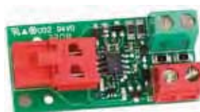
Interface BUS XIB