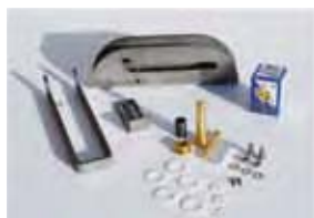
SDE 391, extern ontkoppelingssysteem zonder kabel, voor ontgrendeling van de hekvleugel