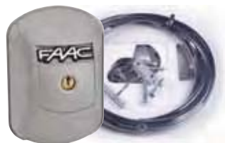
Ontgrendelingsmechanisme inclusief kabel en cylinderslot XK21L 24V