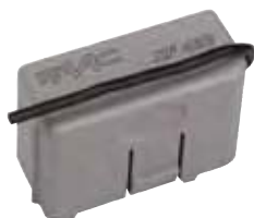
Ontvanger XF868 MHz