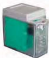
KIT noodbatterij XBAT 24