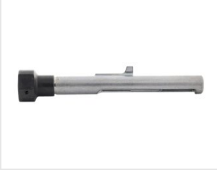
Artikel code 014642 MAGNETISCHE CLIPSHOUDER - PULSA 800E