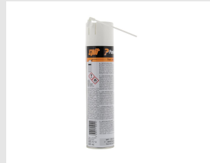
Artikel code 115251 IMPULSE & PULSA REINIGER 300 ML