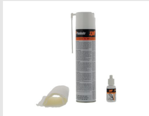
Artikel code 013690 CLEANING KIT (EXCL. FILTER & O-RING)