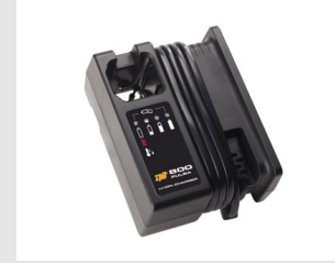
Artikel code 018482 ACCULADER - PULSA 800