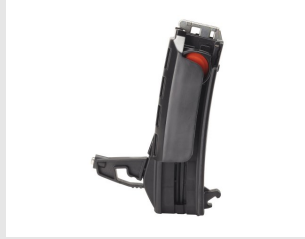
Artikel code 014623 NAGELMAGAZIJN 20 STUKS - PULSA 800