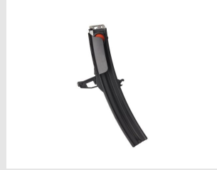
Artikel code 014640 NAGELMAGAZIJN 50 STUKS - PULSA 800