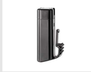
Artikel code 018483 ACCU - PULSA 800