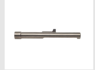
Artikel code 018424 NAGELGELEIDER - PULSA 800P(+)