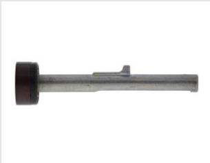
Artikel code 014641 MAGNETISCHE RONDELHOUDER - PULSA 800P(+)