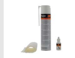
Artikel code 013690 CLEANING KIT PULSA & IMPULSE (EXCL. FILTER & O-RING)