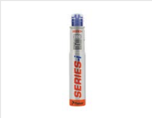
Artikel code 300348 GASPATROON (1X) - IM90 / PPN50