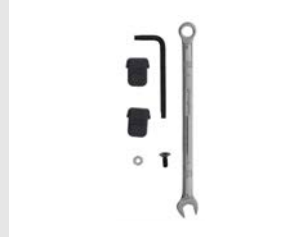
Artikel code 013256 LOS RUBBER, NO-MARK NEUSSTUK VOOR RABAT - IM90Ci & IM90Xi