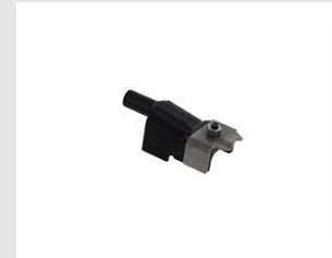
Artikel code 019785 NEUSSTUK VOOR STALEN DAKPANNEN - IM90Xi