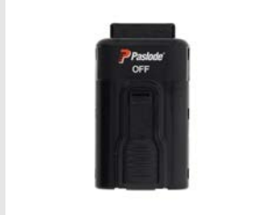
Artikel code 018880 LITHIUM ACCU - IM90Ci / IM90Xi / PPN50Ci / PPN50Xi / IM65-IM50 / IM45