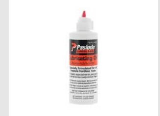
Artikel code 401482 IMPULSE OLIE