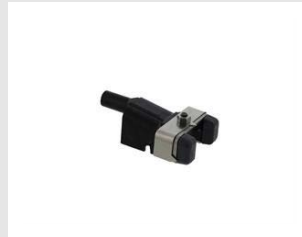
Artikel code 019783 NO-MAR NEUSSTUK VOOR RABATDELEN - IM90Xi