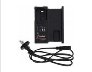
Artikel code 018881 LITHIUM ACCULADER - IM90Ci / IM90Xi / PPN50Ci / PPN50Xi / IM65-50 / IM45