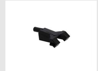
Artikel code 019784 NEUSSTUK VOOR MES & GROEF - IM90Xi