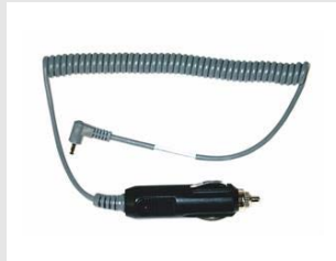
Artikel code 900507 CAR ADAPTER 12V - PULSA / IMPULSE