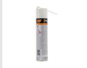
Artikel code 115251 IMPULSE REINIGER 300 ML