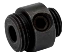
Gatzaag vergrotingsadapter, voor het vergroten van bestaande gaten 3834-UPSIZ