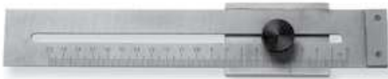
619.501 / 619.201